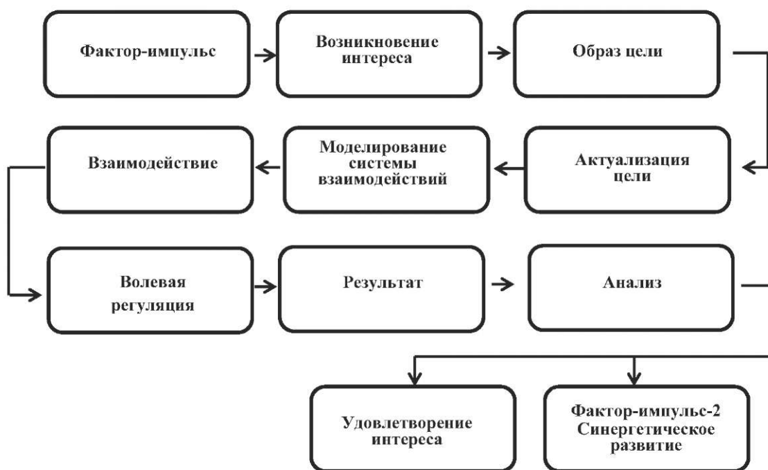
Модель самоорганизации на досистемном уровне

Наблюдая за играми детей во дворах, моделированием из элементов «ЛЕГО», созданием детских страничек в Интернете, организацией флешмобов, сетевым взаимодействием в игровом виртуальном пространстве, мы сделали вывод об отсутствии взрослого организатора детской деятельности, при этом всегда имеет место фактор, «запускающий» процесс самоорганизации: мы назвали его «фактор-импульс». Фактор-импульс - идея, предмет, явление, событие, информация, провокация, породившие в человеке или группе людей интерес и «запустившие» процесс самоорганизации, процесс самоорганизации протекает по схеме (рисунок).