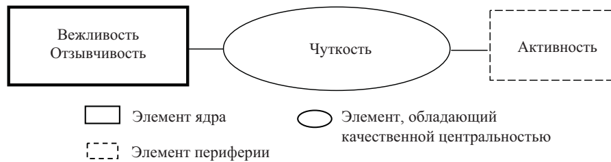
Рис. 2. Структура представления о профессионально важных качествах у студентов с высоким уровнем эмпатии (собственные)