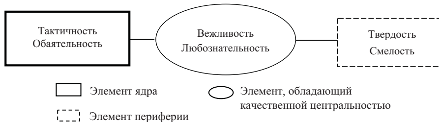
Рис. 3. Структура представления о профессионально важных качествах у студентов с низким уровнем эмпатии

У студентов с низким уровнем эмпатии структуры представлений о профессионально важных качествах социального педагога различаются (рис. 3–4).