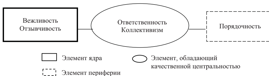
Рис. 1. Структура представления о профессионально важных качествах у студентов с высоким уровнем эмпатии

Структура представления о профессионально важных качествах у студентов с высоким уровнем эмпатии имеет следующий вид (рис. 1).