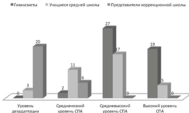
Уровневая характеристика социально-психологической адаптированности (СПА) разных категорий старшеклассников

14% учащихся средней общеобразовательной школы. Такие учащиеся либо плохо учатся в школе и не успевают овладеть программой, либо же вовсе не посещают занятия и находятся под угрозой отчисления; совершают противоправные действия и привлекаются к ответственности; многие имеют тяжелые хронические заболевания, вплоть до инвалидности; в семье наблюдаются постоянные конфликты до полного разрыва отношений; респонденты неразборчивы в знакомствах. Эти подростки злоупотребляют спиртным, склонны к токсикомании; добывая деньги нечестным путем, тратят их на развлечения, не заботясь о завтрашнем дне. Для респондентов свойственно отсутствие планов, асоциальные либо нереальные планы (стать большим начальником, известным политиком и т. п.). Даная группа учащихся легко поддается плохому влиянию и, как правило, безвольна, у них частые аффективные реакции и эмоциональные нарушения.