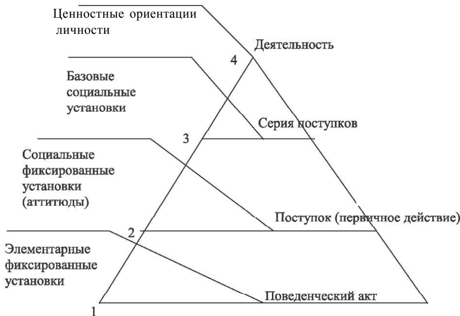
Рис. 1. Иерархическая схема диспозиционной регуляции социального поведения

которых выражается отношение личности к целям жизнедеятельности, к средствам их удовлетворения, т. е. к обстоятельствам жизни, детерминированным общими социальными условиями, типом общества, системой его экономических, политических, идеологических принципов.